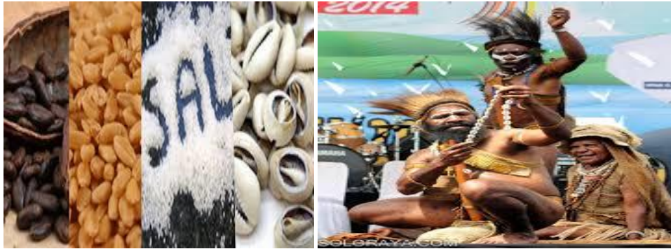
(Gambar 6. Uang Mege ,Garam.)