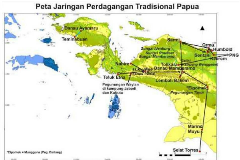
Gambar 1. Peta sinergitas jaringan perdagangan tradisional pesisir-pedalaman Papua. Peta jaringan dikembangkan berdasarkan kajian data arkeologi dan etnografi Balai Arkeologi Jayapura 2010-2014.

Sumber: Balai Arkeologi Jayapura 2010-2014