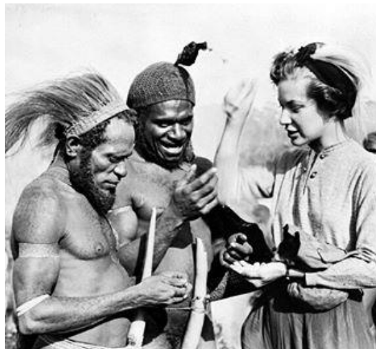
(Gambar 7. Sebuah Transaksi jual-beli menggunakan uang kerang (mege) oleh suku Ekagi/Mee di Paniai dan istri seorang controleur)