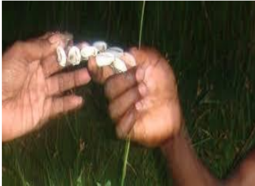
(Gambar 2. Pembayaran dengan Mege di Papua)