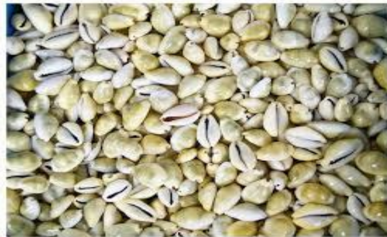
(Gambar 5. Uang Meemege / Kulit Kerang)