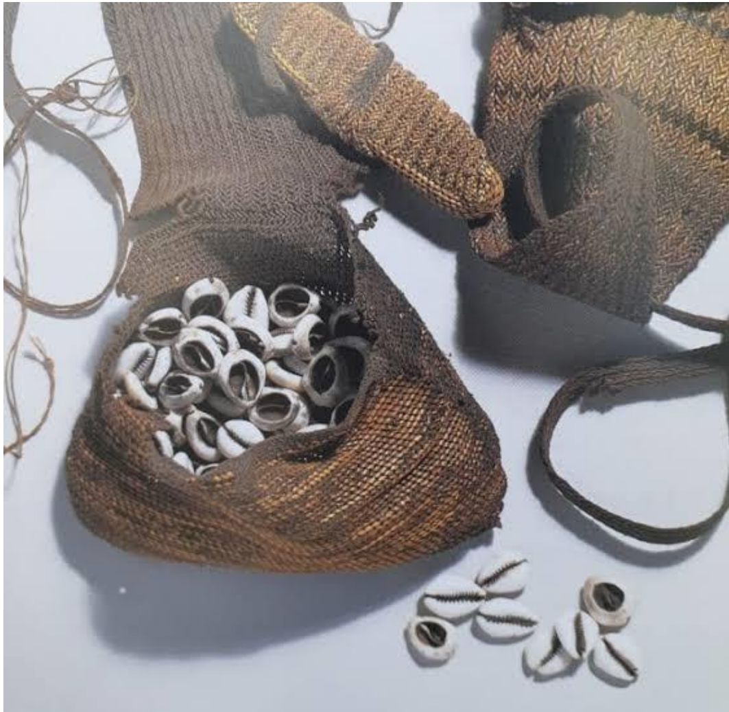
(Gambar 1 : Memege : kerang jenis Cypraea Moneta yang digunakan sebagai alat bayar di daerah pegunungan tengah Papua)